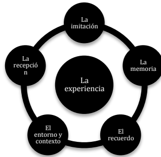
Imagen 1. La experiencia y sus componentes