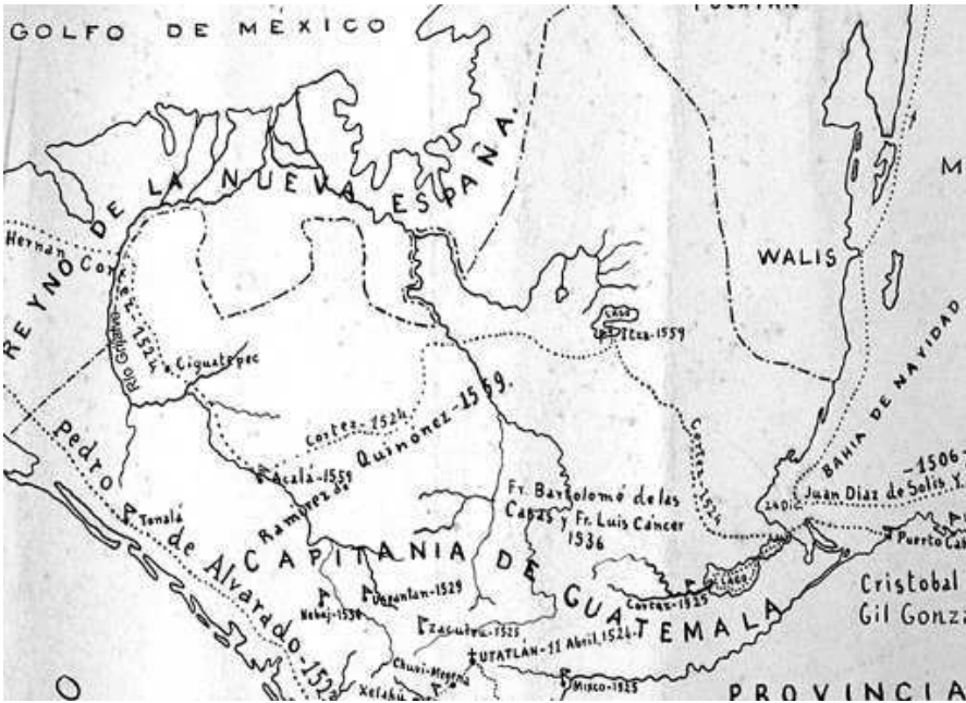
Figura 2. Fragmento de un mapa que muestra, en líneas punteadas, la ruta seguida por los principales conquistadores de la región; y en línea de puntos y rayas, la frontera entre la Nueva España y la Capitanía de Guatemala. Dicha línea y el curso de los ríos Grijalva, al Oeste y Usumacinta, al Oriente, fueron la base para la delimitación del actual estado de Chiapas.

Una vez establecido el dominio español, los habitantes originales que vivían dispersos entre los campos de cultivo fueron obligados a vivir en pueblos congregados, mientras los fugitivos huían hacia las selvas y montañas más aisladas, alrededor de las cuales se fundaron misiones fronterizas desde las que se organizaban expediciones para cazarlos (Gerhard 1991: 7). Chimalapas, situada en la parte intermedia del istmo fue una de estas regiones selváticas y aisladas en las que no penetró la conquista sino muy tardíamente.