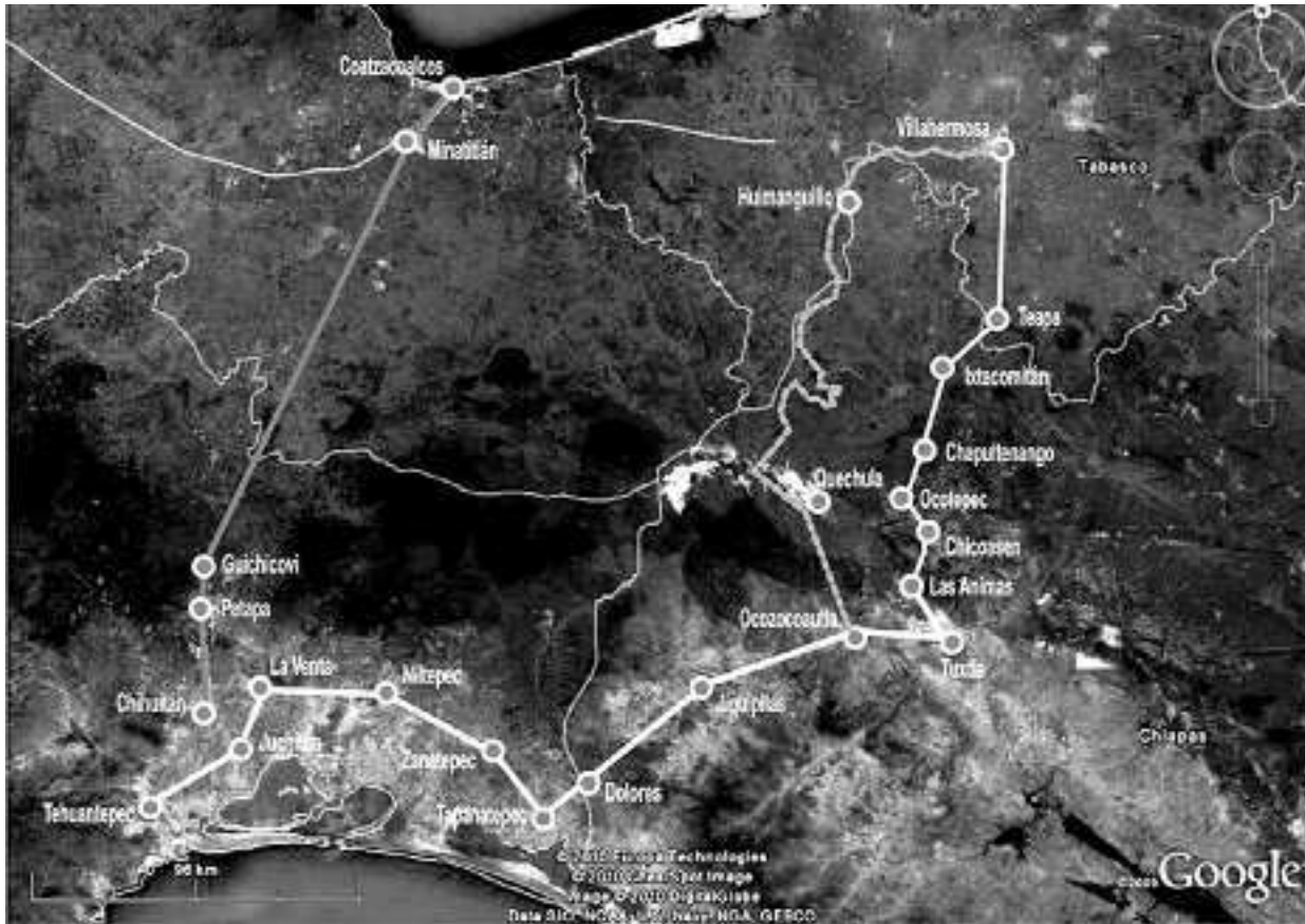
Figura 3. Rutas de comunicación istmeñas en la época colonial (Dibujo: Arq. Manuel Linares Cruz)