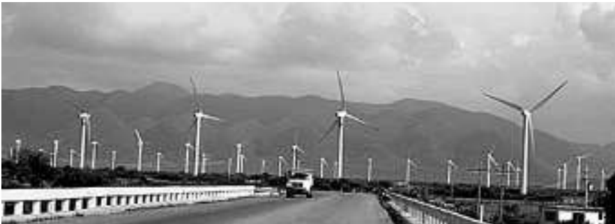
Campo eólico propiedad de una empresa española

Respecto a los medios empleados en la lucha, van desde la queja ante las autoridades agrarias, la denuncia penal ante el ministerio público hasta la aplicación de justicia por propia mano mediante la amenaza y el uso de la violencia. La mayoría de las soluciones a las que se ha llegado son de tipo transitorio y en muy pocos casos son arreglos definitivos. Por ejemplo, hoy día los habitantes de las comunidades indígenas y ejidos istmeños tienen nuevos conflictos debido a la instalación de un parque eólico por parte de una empresa española que lucra con otro más de los recursos naturales de la región: el viento.