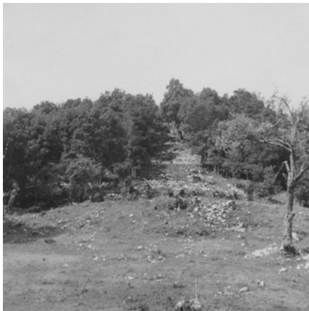
Foto 1. Centro monumental de Moxiquil, original de Frans Blom.