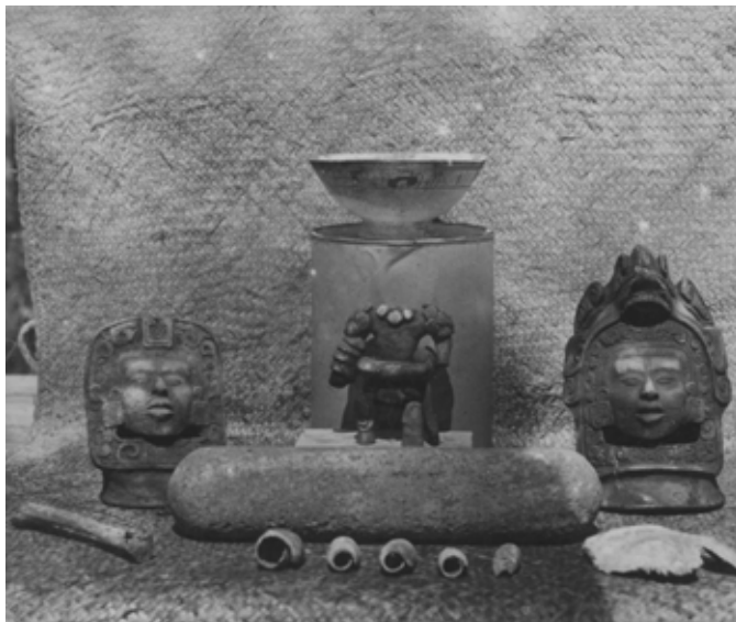
Foto 2. Contenido de la Tumba 3 de la Pirámide Sur, original de Frans Blom