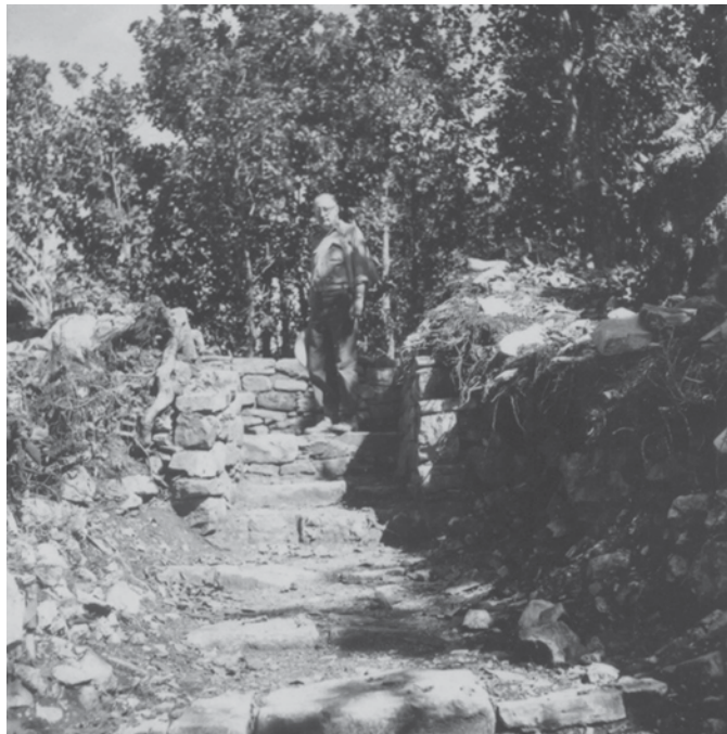
Foto 5. Escalinata monumental que conectaba las terrazas, original de Frans Blom