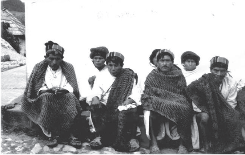
Fotografía 4. Servidores y servidoras de funcionarios religiosos tradicionales, j-ak' yakilo'ctik o los que sirven la chicha, vestidos con traje típico y con telas de algodón en sus cabezas.