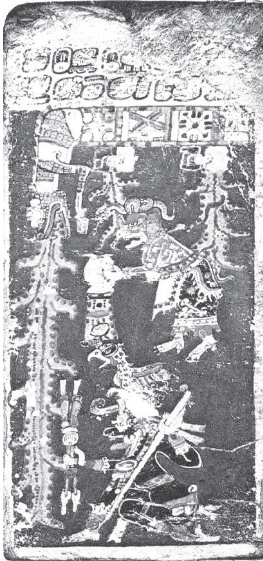
Figura 2. Destrucción del mundo por el agua

Fuente: Lee, Thomas A. Jr. (1989: 74) Códice de Dresde, Los códices mayas.