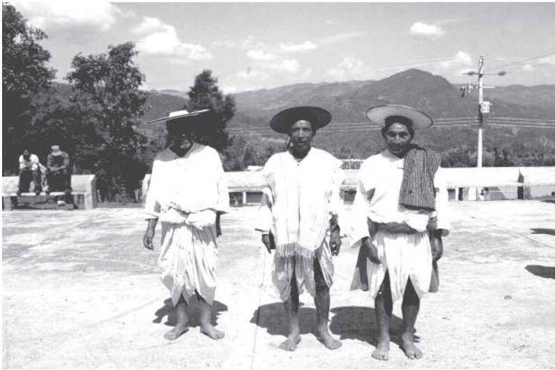
Fotografía 3. Ch'ikovexil o traje tradicional tsotsil del hombre huixteco

De igual manera, comprendo por qué nuestras abuelas y madres siempre se enrollaban el cabello trenzado con tejido de algodón color rojo o chuk jolal alrededor de sus cabezas; de esta manera, puedo afirmar que la forma anterior de peinarse y arreglarse el cabello de las mujeres adultas hasta los años setenta y ochenta del siglo XX se liga con Xchel o Ixchel para nosotros los huixtecos, pues el trenzado del cabello y el enrollado con tela de algodón o chuk jolal alrededor de la cabeza son peinados y arreglos que provienen de la época prehispánica, de la madre Ixchel; desafortunadamente, las mujeres dejaron de usar chuk jolal porque los catequistas de la Iglesia católica de aquel tiempo decían que era malo que las mujeres se peinaran y adornaran sus cabezas y cabello de esa manera.