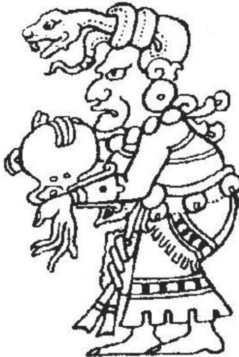
Figura 1. Ixchel, esposa de Itzamná, diosa del parto y del tejido

tercer cuadro, aparece un cuadrilátero donde aparecen los cuatro rumbos del universo y el centro que se conecta con el cielo. Así también, conectadas en la parte superior, debajo de las tres representaciones de los rumbos del universo caen dos torrentes de agua menores: el pequeño en medio, y en el otro extremo, el mediano. A un lado del torrente de agua mayor y abajo de los dos torrentes de agua menores se encuentra la diosa Ixchel en cuyas manos sostiene una especie de recipiente u olla que según mi parecer y de acuerdo a la cosmovisión maya tsotsil está generando vida y no muerte, ahí se conecta con un ave que se parece un águila, inmediatamente, abajo se encuentra el guerrero negro que sostiene en su mano derecha dos flechas y en la mano izquierda porta una especie de bastón. Estos son los aspectos de lo que podemos encontrar en los escritos de los arqueólogos y lo que se puede interpretar en el códice maya sobre Ixchel.