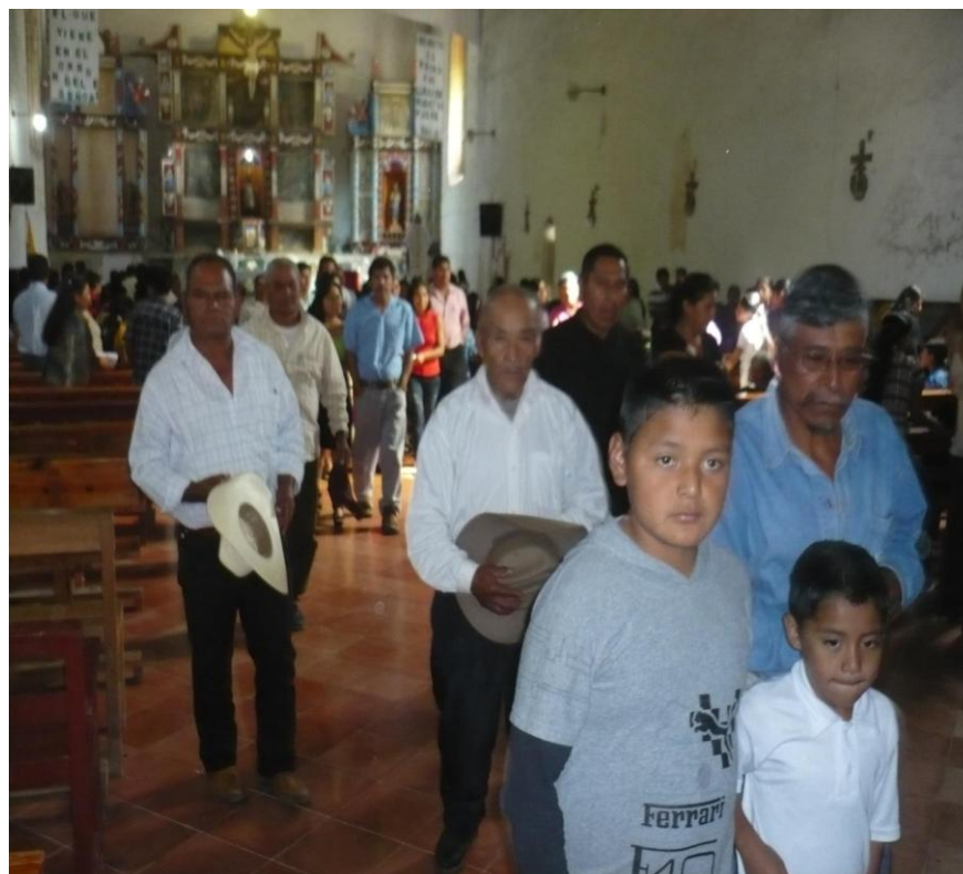
Fotografía 13: Zoques católicos saliendo de la celebración de la Misa