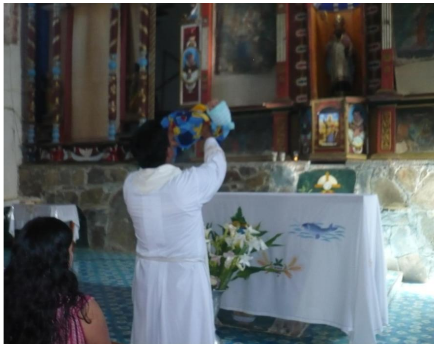
Fotografía 16: Sacerdote católico presentando un infante a Dios

La iglesia católica celebra en su vida ordinaria los sacramentos. Los que pertenecen a dicha fe se preparan para recibirlos adecuadamente; ya que mediante ellos se inician en la vida cristiana y se mantienen en ella. Los sacramentos tienen una base eminentemente bíblica. De los siete que la iglesia reconoce tres son de iniciación –Bautismo, Confirmación y Eucaristía-, dos de curación – Penitencia o Reconciliación y Unción de los enfermos- y dos más al servicio y misión de los creyentes –Matrimonio y Orden Sacerdotal- (Los sacramentos). El recibir un sacramento implica vivir en “estado de gracia”, es decir, libre de pecado mortal. La persona que recibe un signo sagrado en pecado grave teje su propia condenación y por lo tanto, queda excluido de la vida eterna.