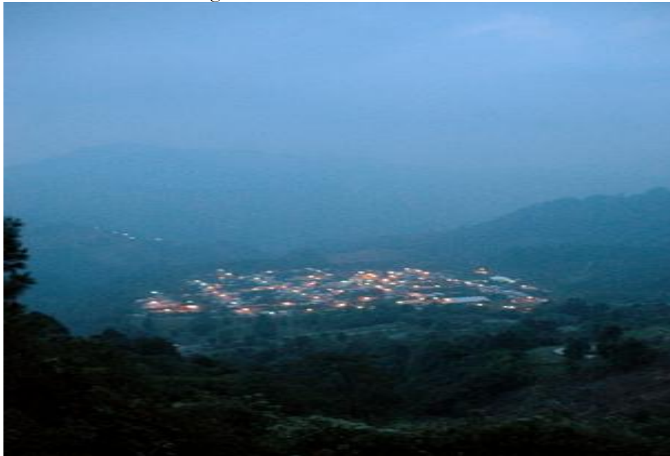
Fotografía 3: vista nocturna de kãñã'mã

La comunidad donde realicé el estudio se denomina Tapalapa, municipio libre de Chiapas, México. Es un poblado que forma parte de una amplia región donde habitaron y, en algunos casos, siguen habitando los zoques, una cultura ancestral, íntimamente conectada con los “mokayas” y olmecas. Antes de presentar algunos datos importantes sobre este antiguo poblado lo voy a ubicar, brevemente, en el contexto histórico del área zoque.