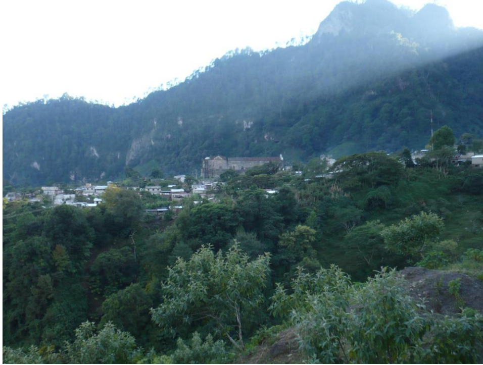
Fotografía 5: Tapalapa, Chiapas.