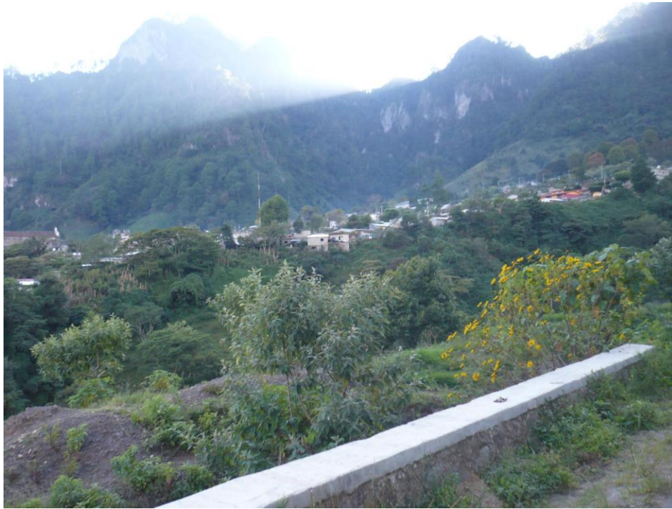
Fotografía 8: lugar donde deambulan los duendes

“Esos chipilines [se refiere a los duendes] no solamente tienen mucha fuerza sino también tienen poder, ¿cómo le dijera? Son como magos o brujos pues con mucha facilidad se pueden convertir en diversos animales. Algunas personas los han visto transformarse en forma de un perro o en gatos negros. También son capaces de volverse invisibles. Hay duendes que caminan solos y otros que nada más andan en grupo, como lo tejones cuadrilleros” 43 .