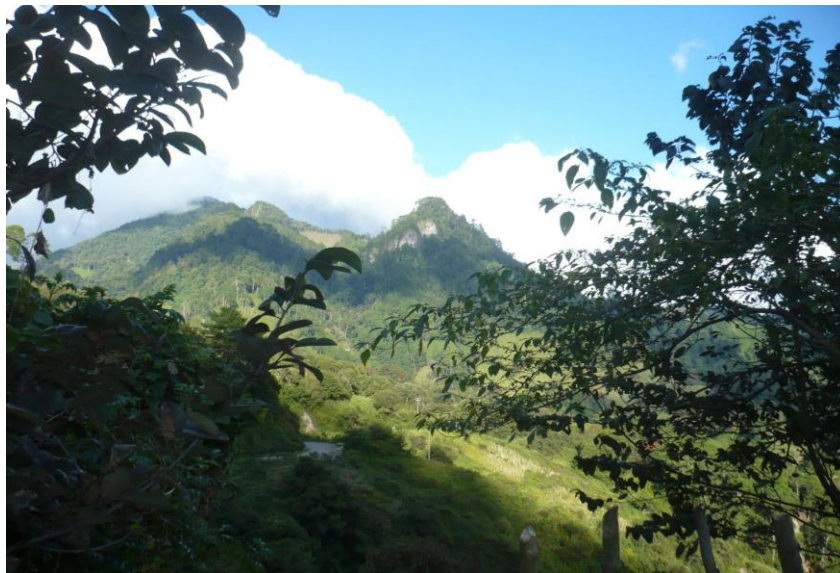
Fotografía 6: montañas de Känä'mä

Este municipio se ubica en las cadenas montañosas del norte del estado Chiapas a 17° 11' 22" de latitud norte y 93° 06' 12" de longitud oeste. Colinda al norte con el municipio de Chapultenango; al sur con Coapilla, al este con Pantepec y al oeste con Ocoatepec. Tiene una extensión territorial de 32.3 km 2 y una altitud de 1720 metros sobre el nivel del mar. Su clima es semi-cálido húmedo con precipitación pluvial durante casi todo el año. Sus principales ríos son el Napac y el Nāwaka.