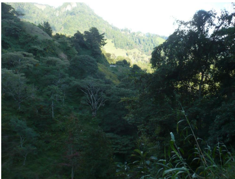
Fotografía 10: zona donde se aparece Mänganan

Mänganan y Näwayomo son dos seres sobrenaturales que castigan la infidelidad sexual de hombres y mujeres casados 90 y de muchachas solteras “en celo” 91 . El primero habita en los bosques de niebla y la segunda mora en las orillas de los ríos o arroyos. Los dos personajes tienen la habilidad de convertirse en hombre o mujer, con rasgos estéticos atractivos a la mirada femenina o masculina zoque.