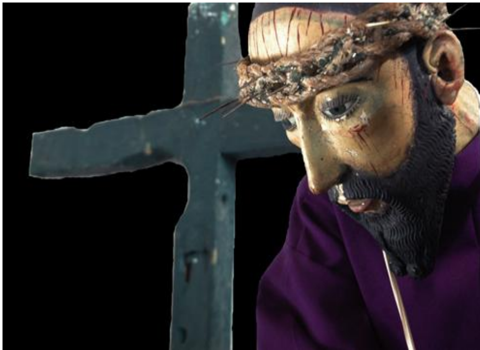
Fotografía 7: imagen de Cristo con la Cruz

En la mentalidad católica Jesucristo es la segunda persona de la Trinidad. Es considerado como el hijo de Dios hecho hombre que murió y resucitó para que los hombres tengan vida eterna. Los adventistas reconocen en Jesucristo al Hijo de Dios y tienen la certeza de que él es su único Salvador. Los zoques denominan generalmente a Jesucristo como Señor. Lo celebran en la Semana Santa, particularmente, el viernes Santo y el domingo de resurrección.