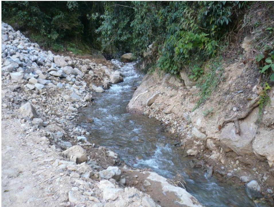
Fotografía 11: río donde aparece Nāwayomo