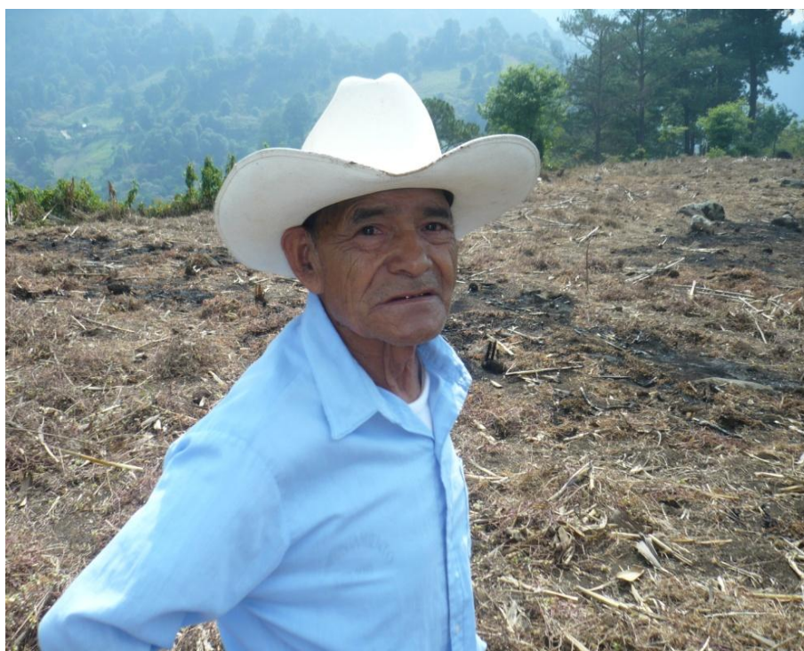
Fotografía 9: curandero zoque en su campo de cultivo

consideran brujo. Cuando lo buscaban para curar a algún enfermo no decía cuánto les iba a cobrar. Una vez que terminaba el tratamiento y si el enfermo se curaba les decía a los familiares del enfermo que le dieran lo que ellos quisieran para mostrar su agradecimiento 67 .