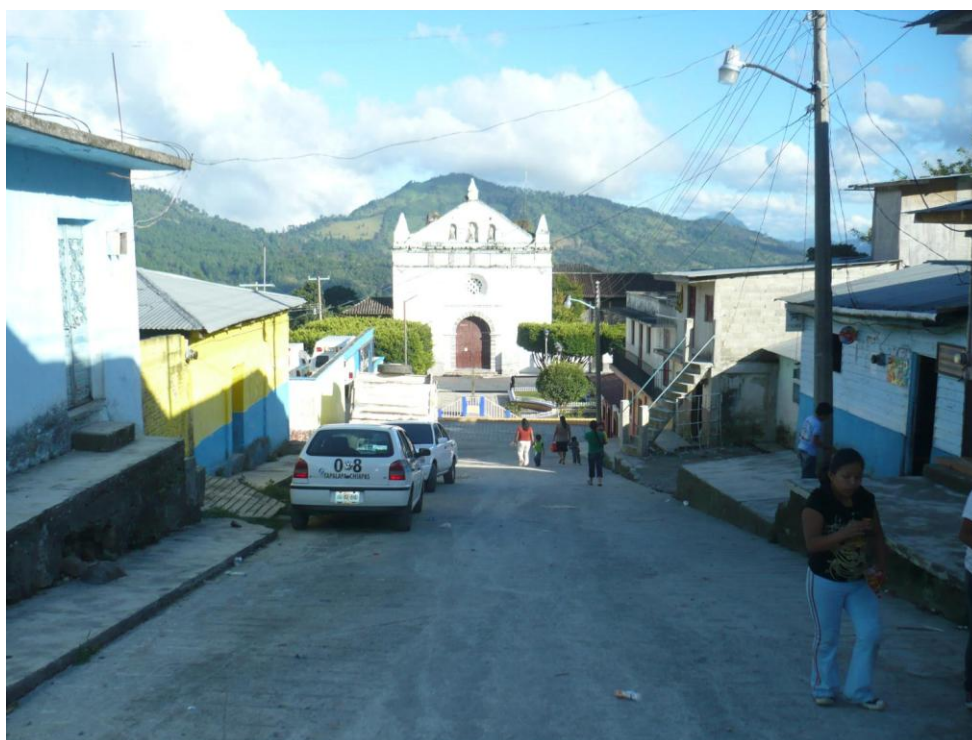
Fotografía 14: Calle principal de Tapalapa, al fondo el templo de San Agustín

La iglesia principal fue construida a finales del siglo XVI. En los archivos parroquiales encontramos un cantoral que data de mediados del año 1500 y libros de matrimonio y defunciones del año 1600. Desde sus orígenes, la parroquia estaba dedicada a San Agustín. Actualmente, alberga una escuela apostólica de adolescentes que quieren ingresar al seminario para formarse como futuros sacerdotes diocesanos.