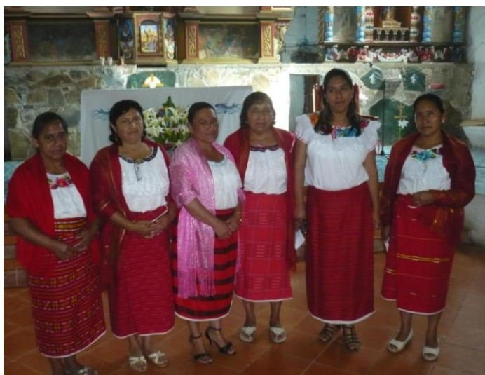
Fotografía15: Miembros del coro parroquial portando indumentaria tradicional

La pastoral indígena es la responsable de la evangelización de los indígenas de acuerdo a su contexto cultural. Esta comisión promueve el uso de la lengua materna –el zoque- en las actividades pastorales de la parroquia y el uso de la vestimenta tradicional de las ministras o miembros del coro y la ejecución de las danzas tradicionales en las principales celebraciones religiosas del pueblo. Finalmente, la pastoral de comunión o de los enfermos es la que se encarga de visitar a los ancianos y enfermos de la comunidad parroquial para alentarlos en su vida de fe, a través de oraciones y pláticas espirituales.