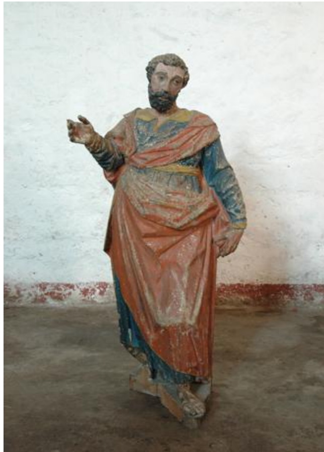
Fotografía 2: ¿San Andrés apóstol?

El patrimonio cultural tangible está integrado por el templo y ex convento de San Agustín que alberga diversas esculturas religiosas que están fechadas entre el siglo XVI y XVIII y por un buen número de objetos sacros de platería. Entre estos encontramos cruces, custodias, incensarios, navetas y ciriales. La mayoría de las esculturas religiosas fueron hechas por artesanos pero hay algunas, como la que mostramos en la fotografía, que son de autor pues muestran gran dinamismo y expresividad. Lamentablemente un buen número de las esculturas religiosas se encuentran muy deterioradas.